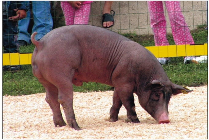
Foto. Lõigatud sabaga siga

Halba õhukvaliteeti peetakse saba hammustamise riskiteguriks [37]. Rootsisis on kehtestatud seakasvatustarajatis-tes erinevate gaaside konkreetseid piirnormid, et tagada vastuvõetav õhukvaliteet: ammoniaagi (NH 3 ) kontsentratsioon ei tohiks ületada 10 ppm, süsinikdioksiidi (CO 2 ) sisaldus võib olla maksimaalselt 3000 ppm ja vesiniksulfiidi (H 2 S) maksimaalne sisaldus 0,5 ppm [25]. Need gaasid ei tohi ületada maksimaalset kontsentratsiooni, välja arvatud ajutiselt, näiteks läga eemaldamisel [25]. Orgaaniliste tolmuosakeste kontsentratsioon ei tohi ületada <10 mg/m 3 [25]. Gaaside kontsentratsiooni mõõdavad loomade heaolu inspektorid ametlikel loomade heaolu kontrollkäikudel, tagamaks vastavus seadusest tulenevatele nõuetele [43]. Need piirnormid on madalamad kui enamikus teistes ELi liikmesriikides aktsepteeritud piir-