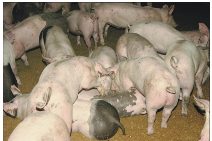
Foto 2. Lõikamata sabaga nuumikud piisava tuhnimismaterjaliga allapanul

Rootsil on pikaajalised traditsioonid lõikamata sabaga sigade kasvatamisel ja enamikus farmides peetakse saba