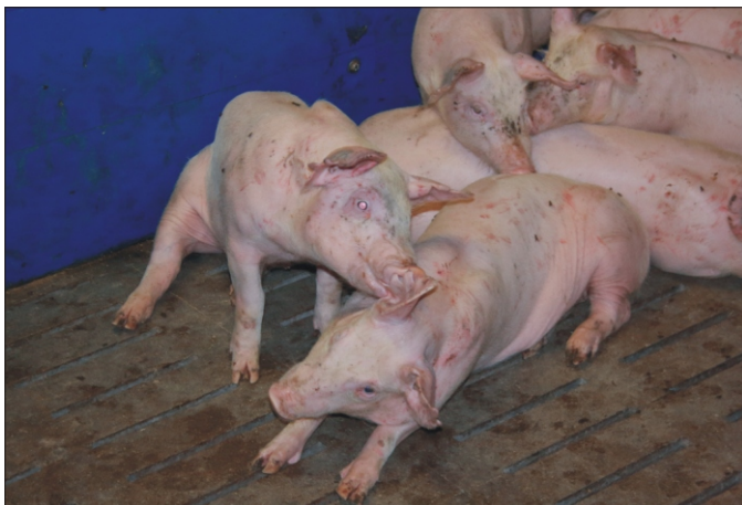
Foto 1. Agressiivne siga täispilu põrandal